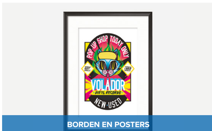
BORDEN EN POSTERS